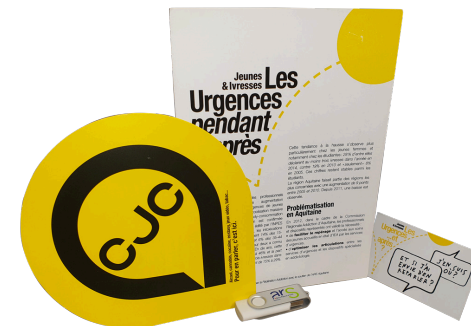
le kit jeunes et urgences

Obtention d'un financement de l'Agence Régionale de Santé pour 3 ans dans le cadre de l'appel à projet du Fonds Addiction 2019-2021